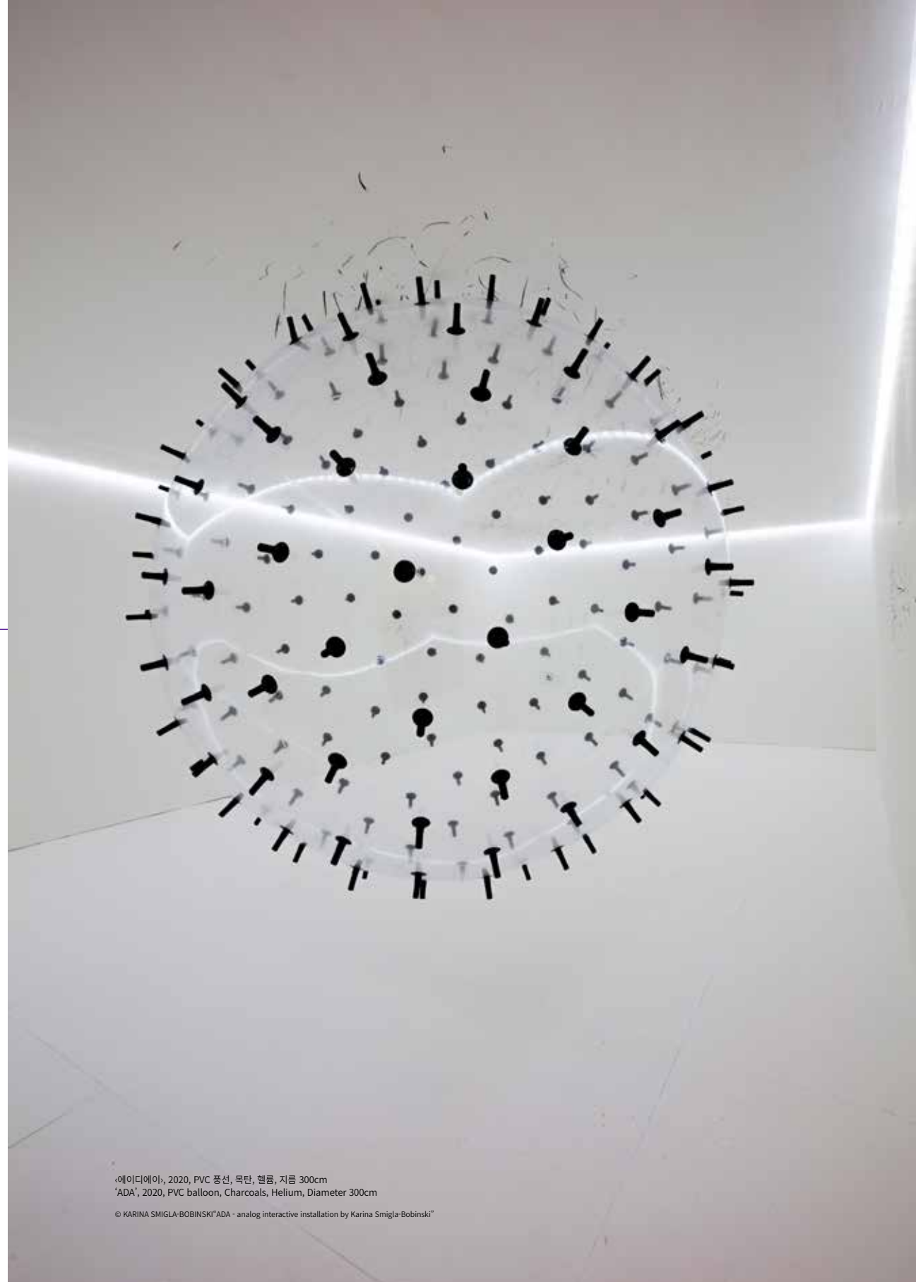
·에이디에이, 2020, PVC 풍선, 목탄, 헬륨, 지름 300cm ·ADA, 2020, PVC balloon, Charcoals, Helium, Diameter 300cm

‘ADA’ is much larger, esthetical much complexer, an interactive art-making machine. Filled up with helium, floating freely in a room, a transparent, membrane-like globe, spiked with charcoals that leave marks on the walls, ceilings and floors. Marks which ‘ADA’ produces quite autonomously, although moved by a visitor. The globe obtains aura of liveliness and its black coal traces, the appearance of being a drawing. The globe put in action, fabricate a composition of lines and points, which remains incalculable in their intensity, expression, form however hard the visitor tries to control ‘ADA’, to drive her, to domesticate her.