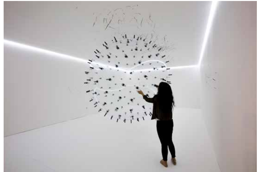
© KARINA SMIGLA-BOBINSKI "ADA - analog interactive installation by Karina Smigla-Bobinski"