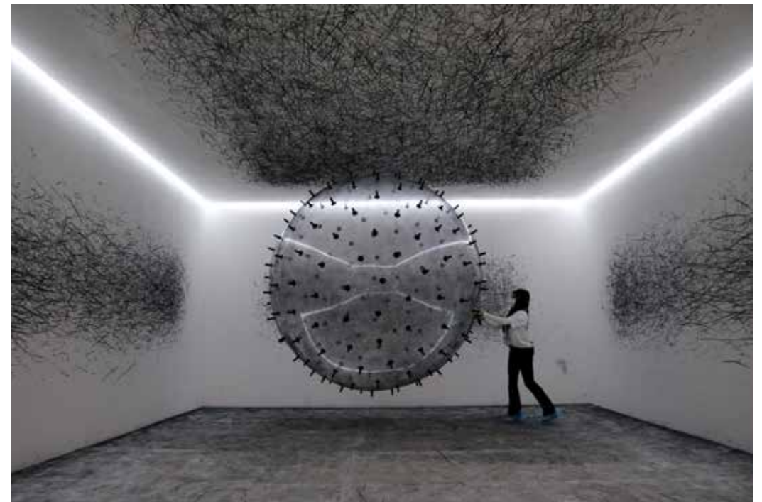
© KARINA SMIGLA-BOBINSKI "ADA - analog interactive installation by Karina Smigla-Bobinski"